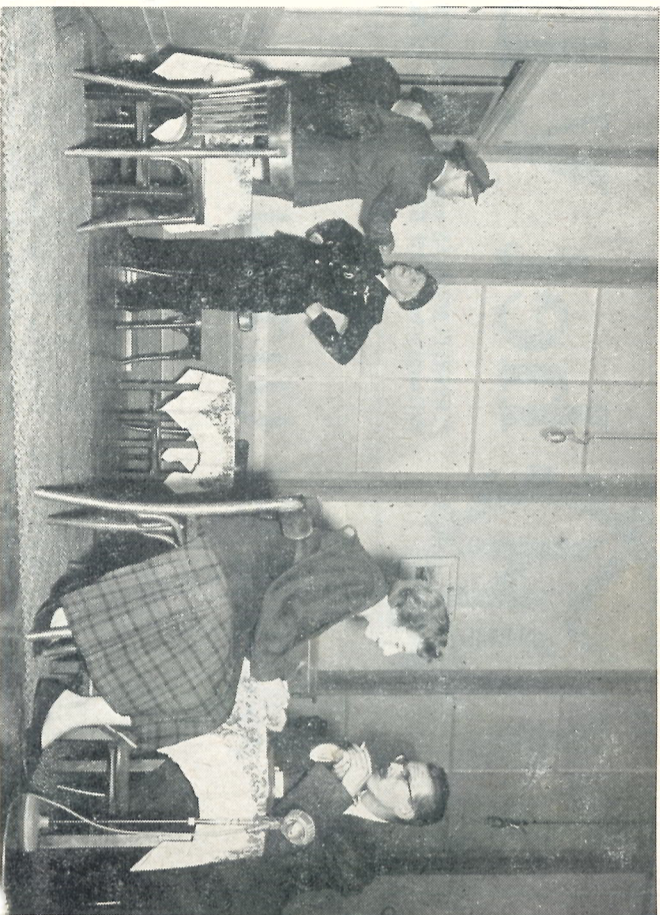
Een spelmoment uit „Toevallige ontmoeting”

Alle nevenoverwegingen ter zijde stellende — en onjuiste maatstaven vernijdende — herhalen wij van mening te zijn dat onze groep waardering toekomt voor het gebodene. Zeer beslist kan daarop aanspraak worden gemaakt door mevr. Vergeer-Maaskant, die de moeilijke vrouwelijke